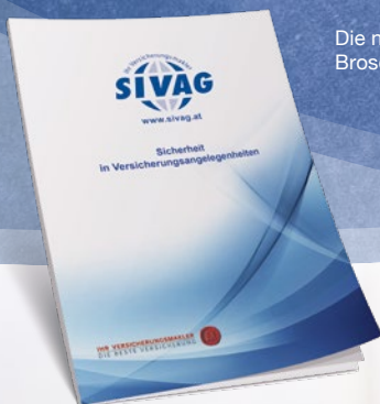
Die neue SIVAG-Broschüre ist da!

Trotz allem: Das persönliche Gespräch und die persönliche Beratung sind nicht ersetzbar und werden auch in Zukunft unsere großen Stärken sein!