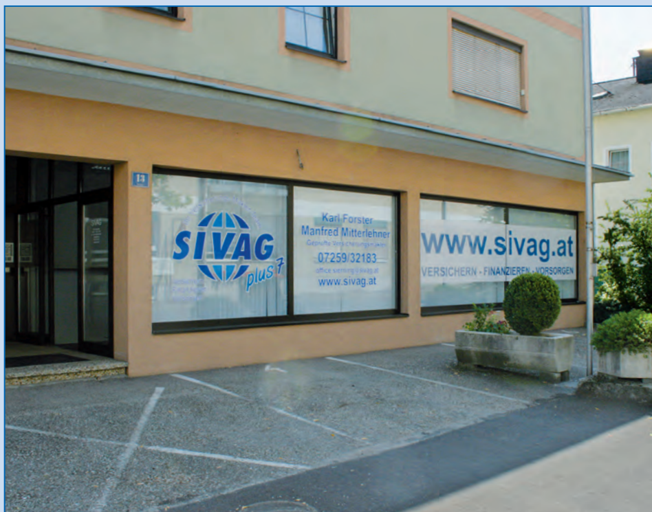
Unser neuer Standort in Sierning.

Nach 10 Jahren SIVAG Steyr nun SIVAG Sierning